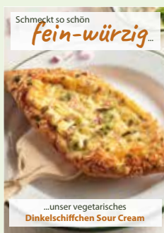
Werbeplakat im Hoch- oder Querformat