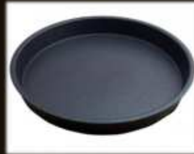
Snackschale ø 25 cm