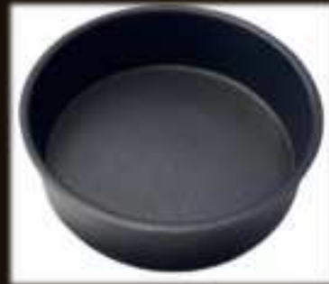
Snackschale ø 19 cm