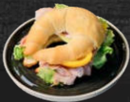
1011224 Midi-Frühstückskipferl 40 Stk. à 50 g / gr. Karton 2 min fertig backen*