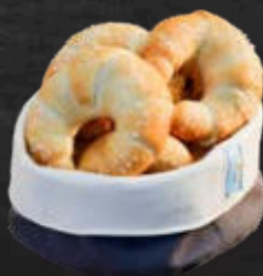
1040283 Midi-Briochekipferl 40 Stk. à 50 g / gr. Karton 2 min fertig backen*